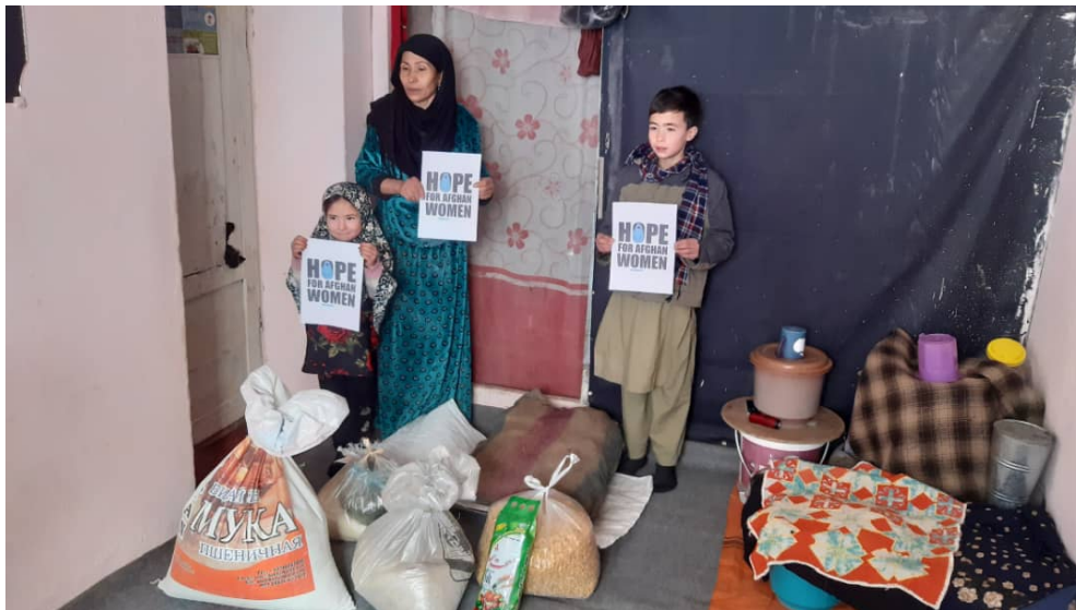
Des bénéficiaires de l'association, en décembre 2021

HFAW a démarré ses activités en 2020 avec un focus particulier sur la formation et des femmes et la scolarisation des enfants, dans un but très précis : l'autonomisation des populations fragilisées, et en l'occurrence l'autonomisation des femmes et des petites filles, parentes pauvres du système afghan. Les enfants, notamment les filles, qui jusque-là n'étaient pas scolarisées, devaient avoir la chance de pouvoir aller à l'école 3 . Cette vision à long terme reste l'objectif de HFAW, même si l'association se consacre pour l'instant essentiellement à une aide d'urgence alimentaire et de santé.