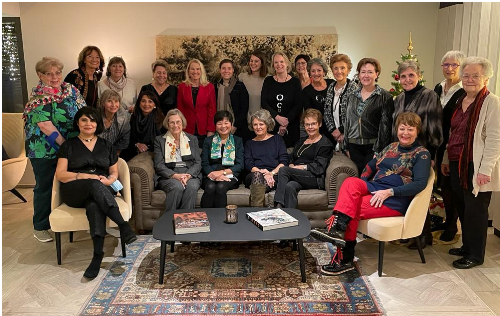
Le Club Soroptimist International de Nyon

À fin 2021, Hope For Afghan Women compte une dizaine de membres et une centaine de donateurs privés. Les membres sont essentiellement issus du réseau de sa fondatrice, à savoir un réseau de professionnels de la santé. Le site internet de l'association présente les différentes activités, avec des photos et témoignages vidéo de bénéficiaires : www.hopeforafghanwomen.com